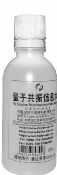
Bottle of 200 ml