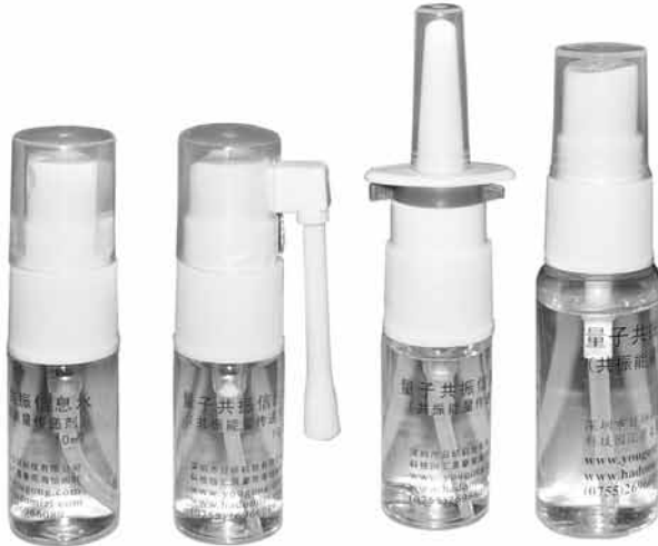
Small spray bottle of 10 ml