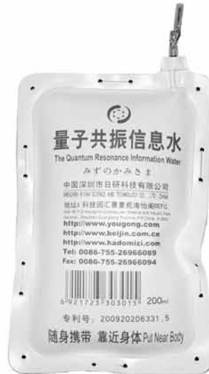
Bag of 200 ml